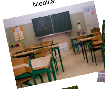
Projekt 2009 Möbiliar