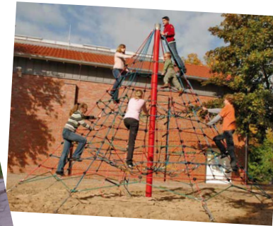
Projekt 2012 Kletterspinne