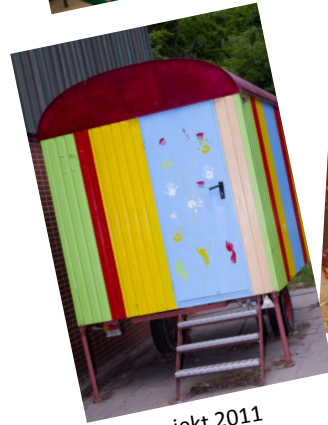
Projekt 2011 Bauwagen f. Pausenspielzeug