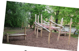
Projekt 2013 Niedrigseilgarten