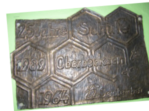
Projekt 2014 50. Jubiläum